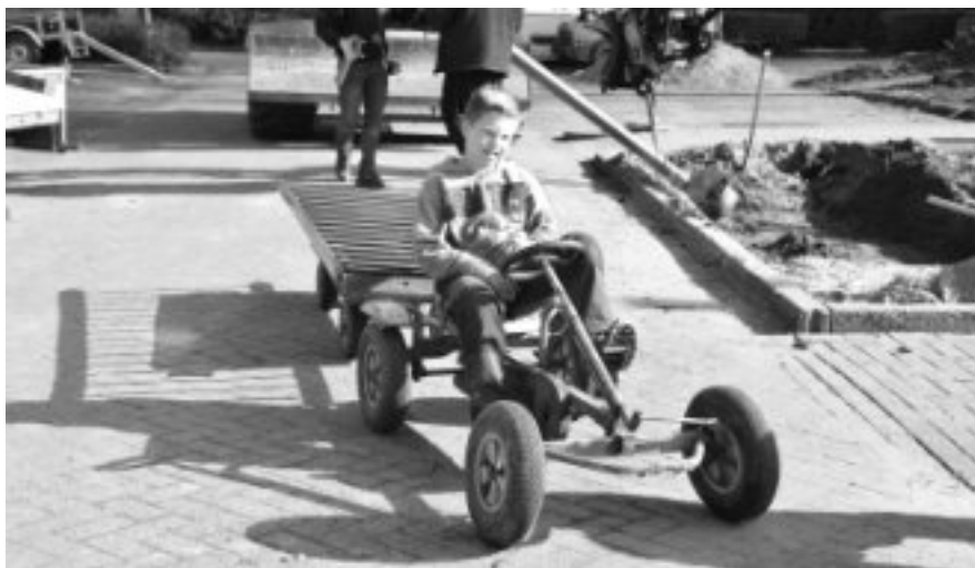
Het transport van de bouwmaterialen van de oude naar de nieuwe school is goed geregeld.