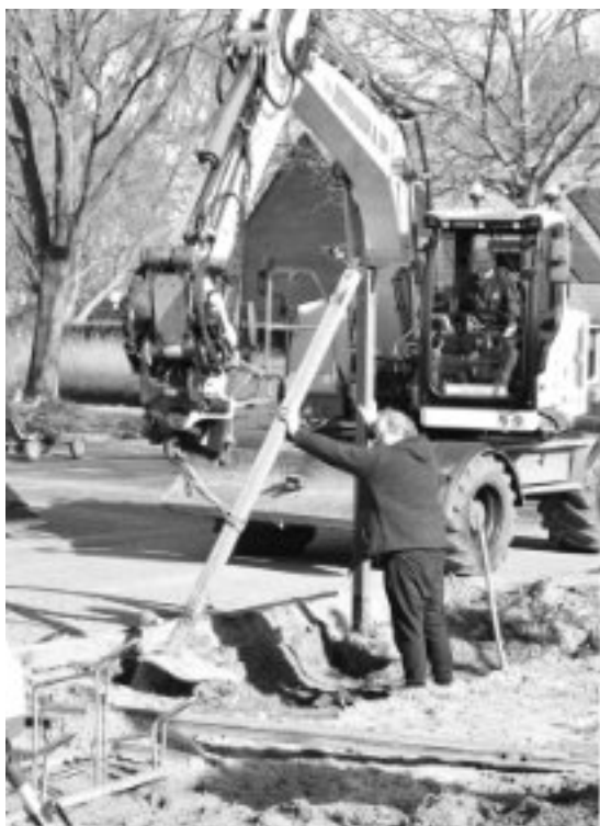
De schommel wordt geplaatst.