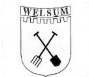
Plaatselijk Belang Welsum