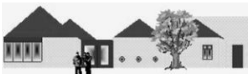
Dorpshuis “de Bongerd”