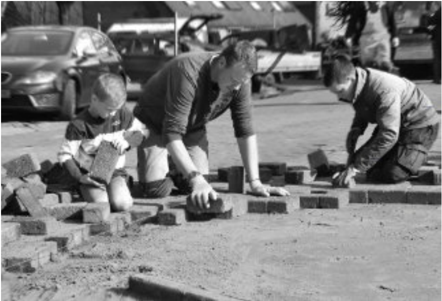
Jong geleerd, oud gedaan.