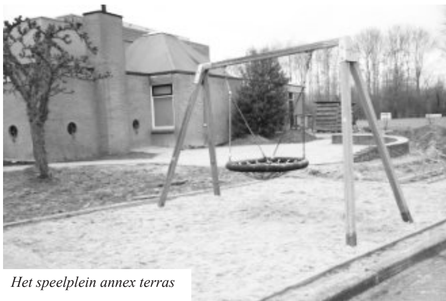
Het speelplein annex terras