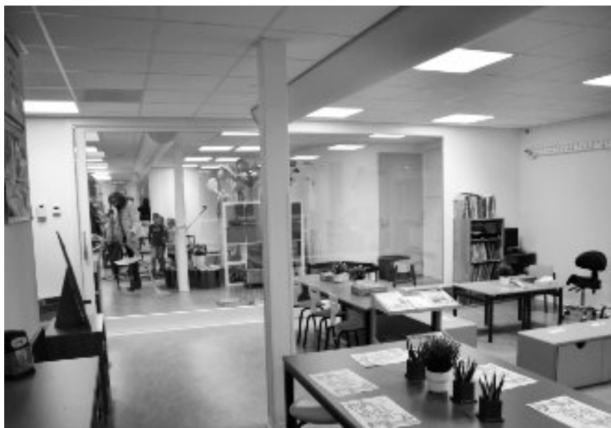
Een doorkijkje door de school